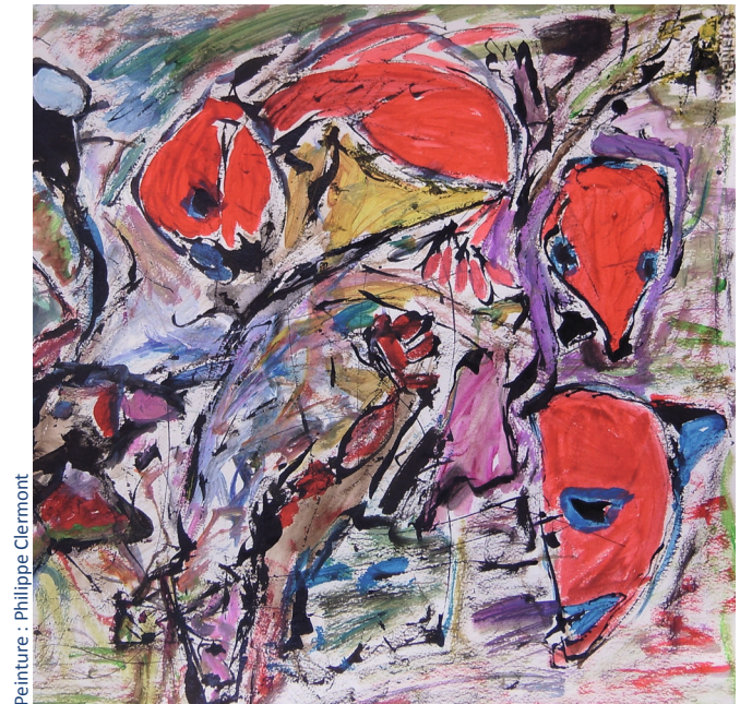
Peinture : Philippe Clermont

Faculté de Médecine | Auditoire Maisin - Auditorios Centraux Avenue Mounier 51 | 1200 Bruxelles